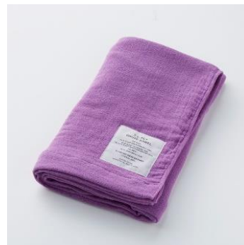
2.5-PLY GAUZE BATH TOWEL (L) Peach 限定カラー 3,456 円