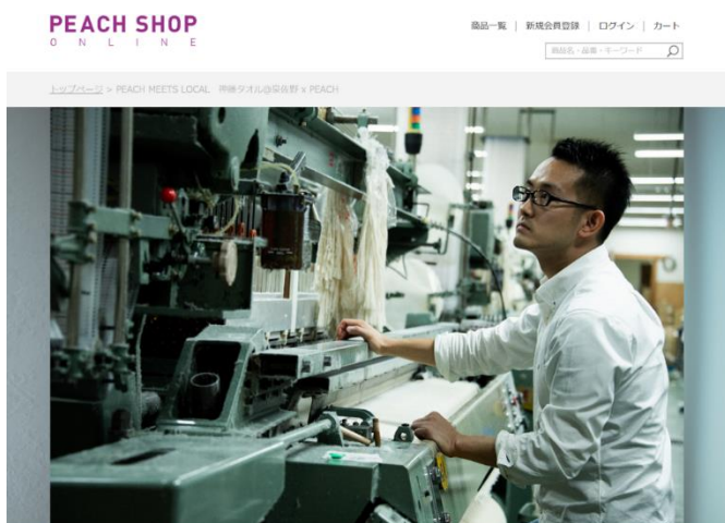
「PEACH MEETS LOCAL」より抜粋

2018年12月5日(水)より運営開始。「気軽すぎる旅」、「Peach オリジナルグッズ」、「PEACH MEETS LOCAL」を軸に、Peach独自の視点でセレクトした旅に関連するアイテムを中心に展開。