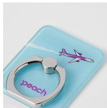
Peach オリジナル スマホリング 972 円