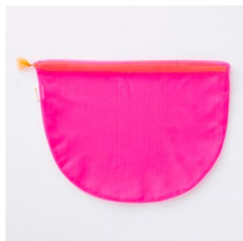
Lagimusim / 巾着 Big Peach 限定カラー 1,026 円