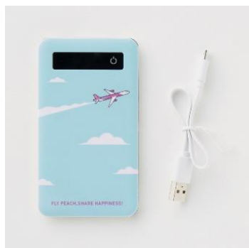
Peach オリジナル モバイルバッテリー 3,564 円