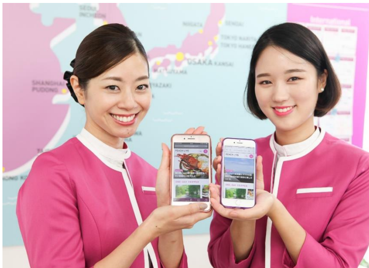
リニューアルした PEACH LIVE WEB を紹介する Peach 客室乗務員