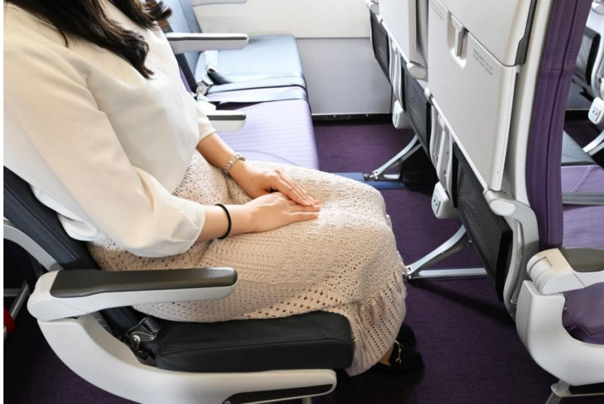
写真の座席のシートピッチは 31 インチ(約 78.7cm)

シートピッチは、30~32 インチ(約 76~81cm)、各座席には充電用の USB 端子を設けるなど、機内での快適性が向上しています。エアバス社の航空機は、他社の航空機と比べ、座席幅が 1 インチ(約 2.5cm)広く、ゆとりのある機内空間を実現しています。航続距離は 7,400km で、CFM 社製の LEAP-1A エンジンやシャークレット(大型の翼端板)を採用しており、従来機(A320ceo)と比較し、約 20%の燃費向上を実現しています。