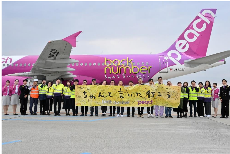
back number ジェットと横断幕を持つ Peach 社員